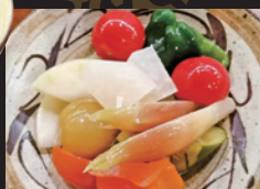
和創作えん 自家製 野菜のピクルス ほか「ぶちぶよの天ぷら」