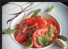
kana's kitchen at RecaD トマトを使った Pasta ほか「前菜またはデザート」