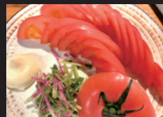
陽はまたのぼる 焼肉 荻の冬トマト スライス