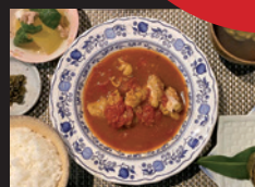
庄屋 (トラベルイン吉富) トマトシチュー