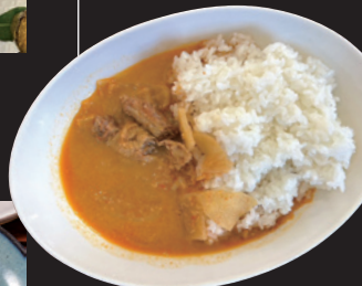
竹田丸福 トマトとクーの 荻っ子カレー