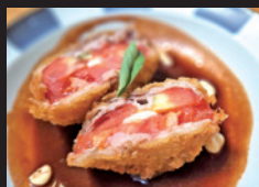
角仲島屋羅夢歩 モッツアレラチーズと トマトのミルフィーユカツ ほか「牛肉とトマトのイタリアン炒め」