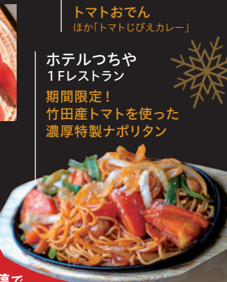
ホテルつちや 1F レストラン 期間限定！ 竹田産トマトを使った 濃厚特製ナポリタン