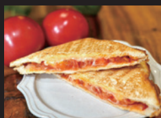
竹田カフェ ハム&チーズ&トマトの ホットサンド ほか「トマトカレー」