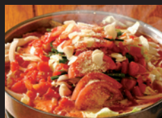
陽はまたのぼる 竹田本店 スパイシーチーズ トマトモツ鍋