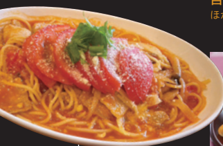
KRONE DINING 冬トマトと ブタ肉の Pasta