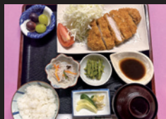
御宿・割烹 一竹 荻のトマトを使った ウースターソース (白身フライやチキンカツに付きます)