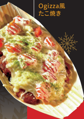
K-TAKO Ogizza風 たこ焼き