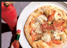
kips Freshトマトの マルゲリータ ほか「生トマト入りトマトソース」