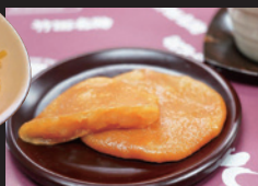
生長堂 (キリシタン資料館内) トマトはら太