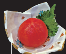
常連 トマトおでん ほか「トマトじびえカレー」