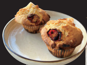
いちとなな ドライトマトと カマンベールの マフィン