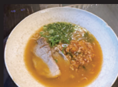
88スタイル トマトラーメン